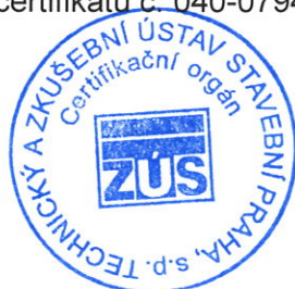
Razítko certifikačního orgánu

Tato příloha je nedílnou součástí certifikátu č. 040-079402.